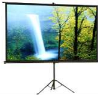
ภาพถ่ายครุภัณฑ์

วงเงินที่ก่อหนี้ผูกพัน : 48,000.00 บาท เบิกจ่ายแล้ว 48,000.00 บาท